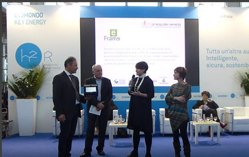
2016 | Premio Sviluppo Sostenibile