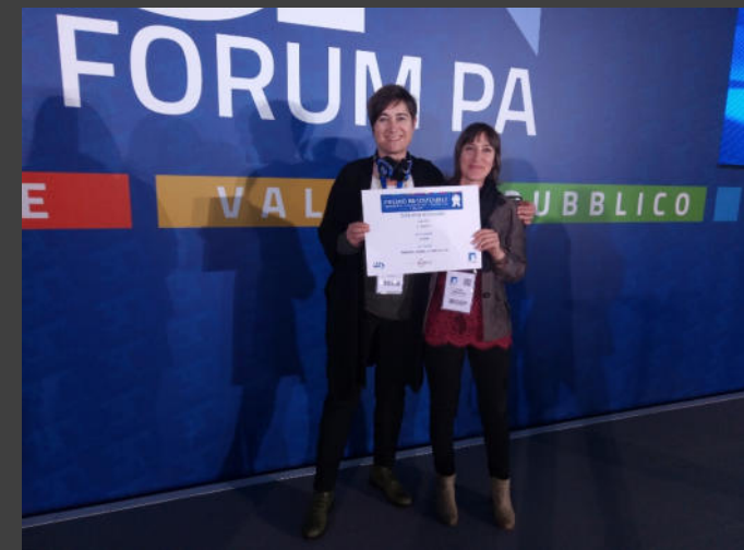
2019 | Forum PA sostenibili